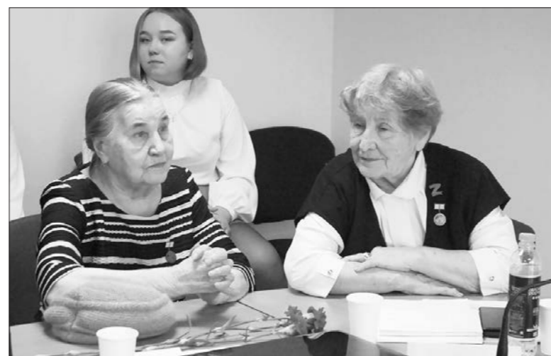
В челябинской студии