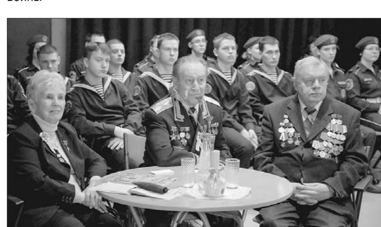
В студии Санкт-Петербурга