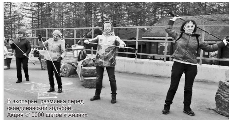
В экопарке разминка перед скандинавской ходьбой. Акция «10000 шагов к жизни»

вeterанского движения и являются связующим звеном между администрацией лечебного учреждения и пожилым населением района. Свои усилия медицинская комиссия района и Совет общественности направили на упорядочение работы регистратуры поликлиники. По их инициативе в регистратуре было организовано