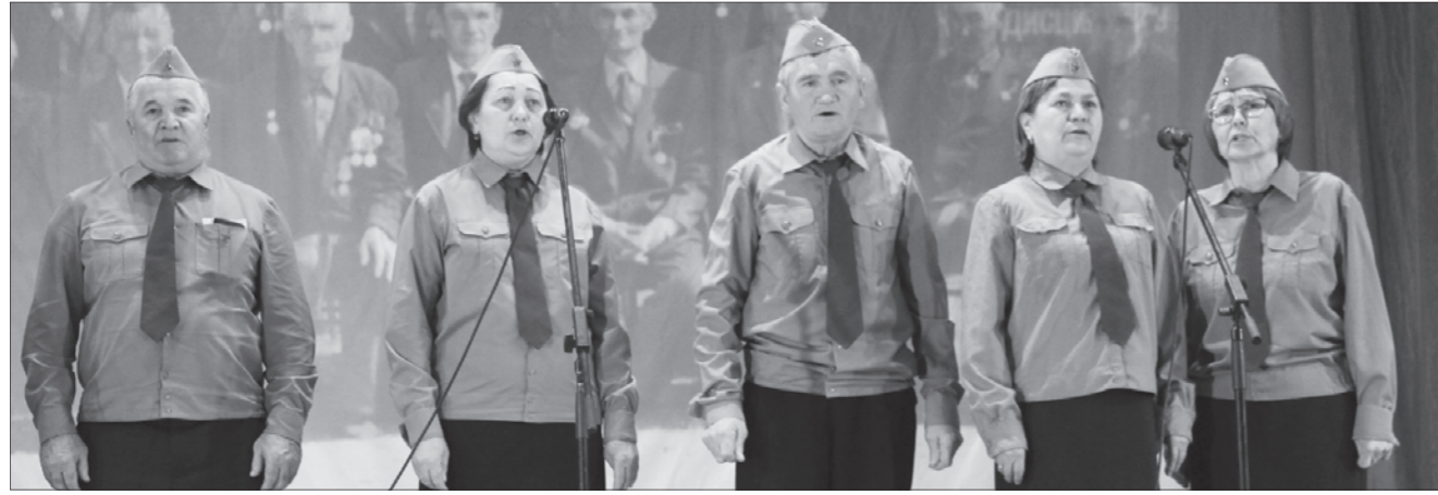
В Аргаяше возродили традицию исполнять патриотические песни на главной сцене района.