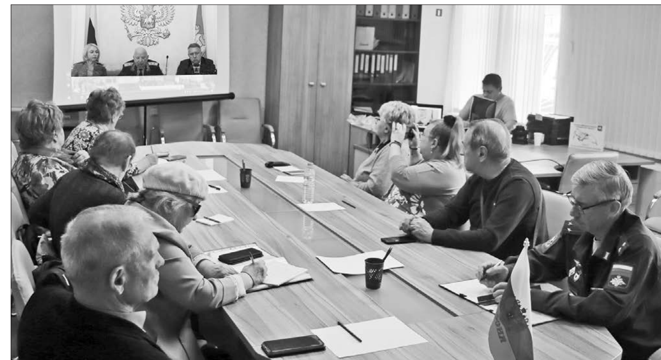
Участники пленума в Тракторозаводском районе Челябинска

Забывты Пушкин, Лермонтов, Гоголь, Тургенев, Гончаров, Достоевский, Толстой, Чехов,