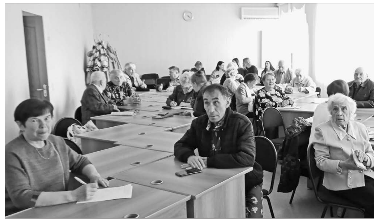
Участники пленума в Миассе

● пионерские организации в доме-интернате № 9 в Ленинском районе города Челябинска в составе 20 человек, в школе д. Арасланова в Нязепетровском районе (27 человек) и 2 пионерских отряда в школе № 3 г. Нязепетровска (43 человека).