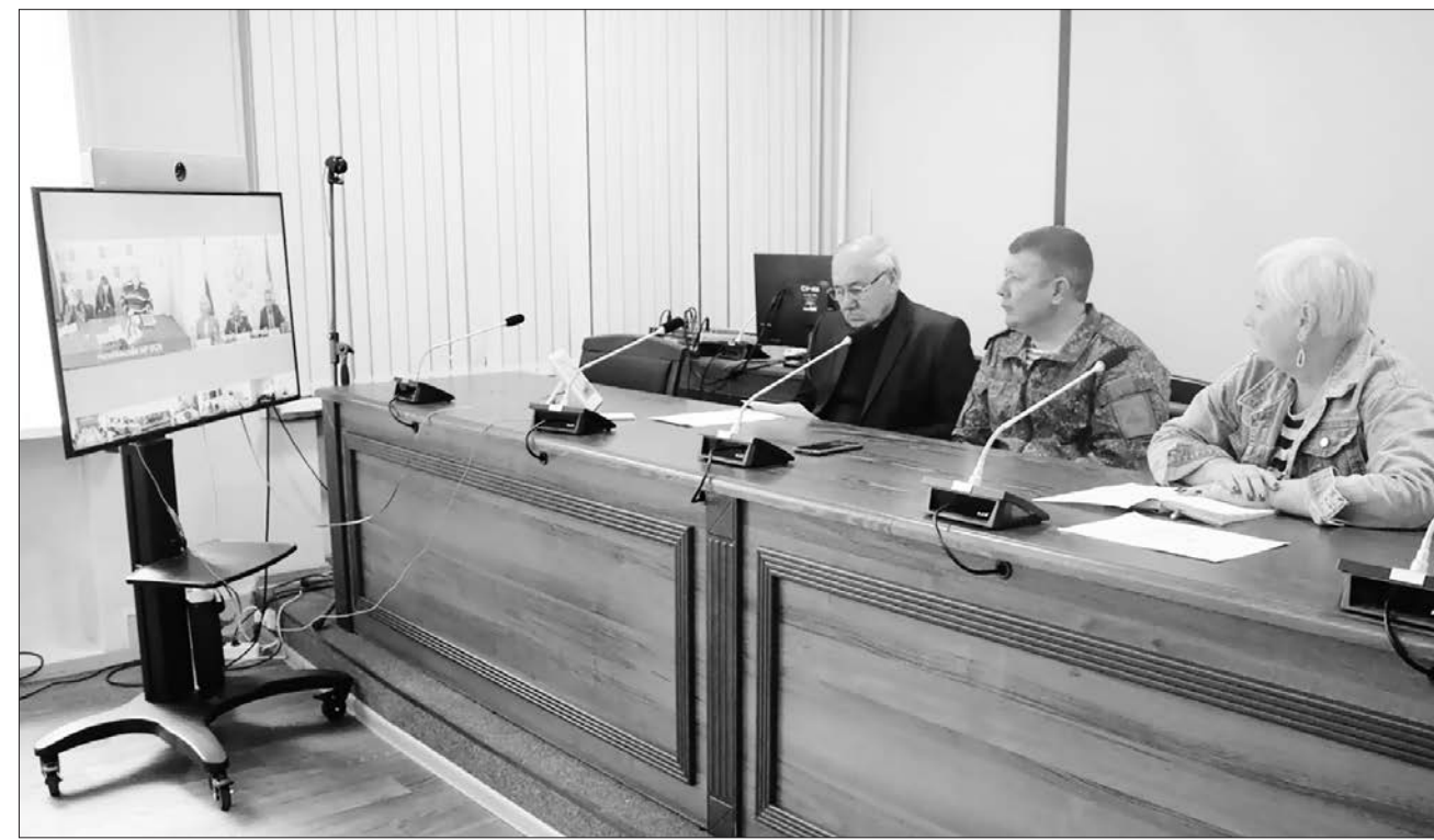
Участники пленума в Верхнеуральске