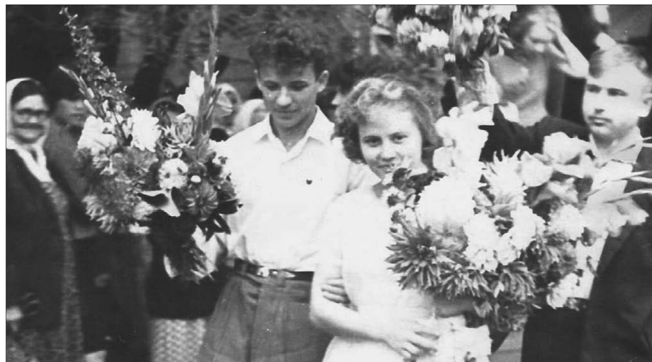
«Моя семья родилась у токарного станка механического цеха паровозного депо станции Троицк...»