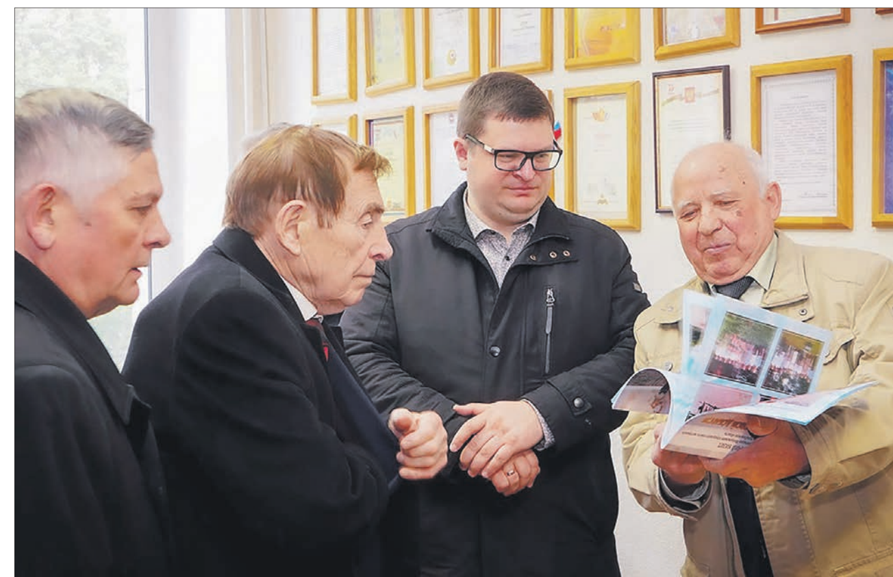
Гости из Москвы в Челябинском областном Совете ветеранов

Для нас уже стали обыденными просьбы ветеранов Содружества об оказании им содействия в оперативном оформлении