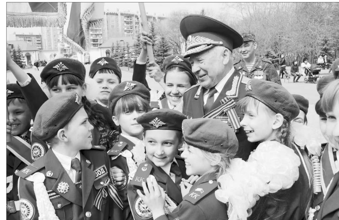
«Недавно прозвучали предложения ввести в школьную программу семейное воспитание... Хорошая инициатива. Очень важно прививать детям понимание того, что такое семья»

Недавно прозвучали предложения ввести в школьную программу семейное воспитание... Хорошая инициатива. Очень важно прививать детям понимание того, что такое семья»