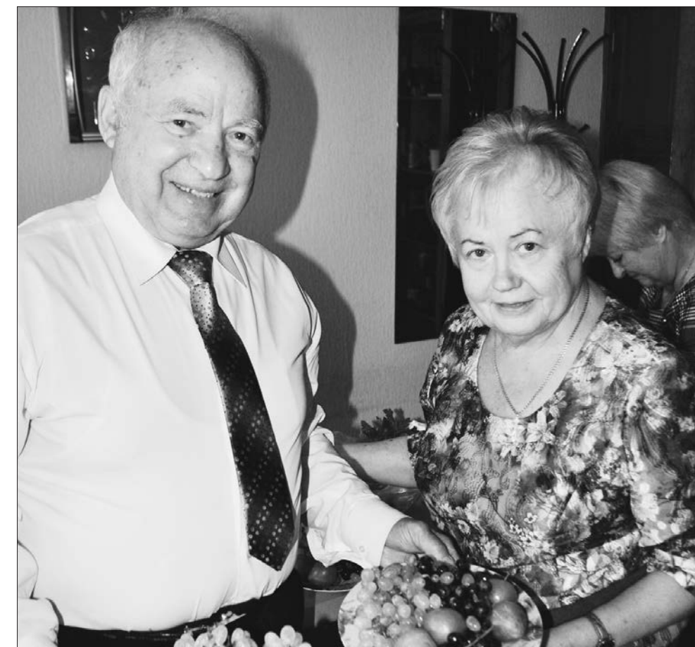
«За совместно прожитые годы мы в буквальном смысле слова слились в единое целое, стали похожи друг на друга во многом: в мыслях, подходах, планах, в оценках, в поведении...»

В 2000 году установлен один из самых значимых праздников — День матери, недавно учрежден День отца. Государство пытается вернуть отца на передовой план укрепления семейных уз, т.е., добытчика — к воспитательной функции. Помните, М. Шолохов свой рассказ «Судьба человека» закончил так: «Хотелось бы думать, что... этот русский человек, человек нестигаемой воли выдюжит, и около отцовского плеча вырастет тот, который повзрослеет, сможет все вытерпеть, все преодолеть на своем пути, если к этому позовет его Ро-