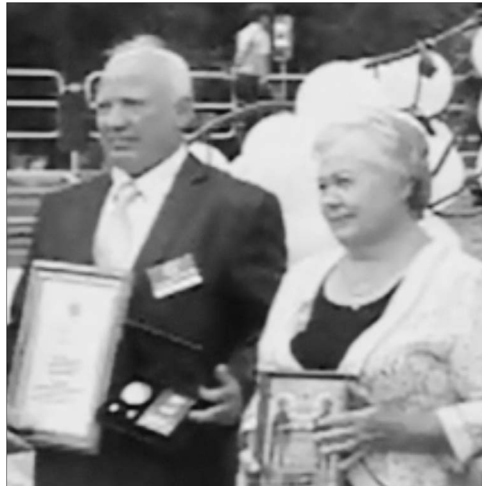
«Особая общественная награда учреждена в России в честь святых Петра и Февронии. 7700 южноуральских семей, в том числе и моя, уже награждены медалью «За любовь и верность»...»

Раньше была тайна семьи. Сегодня таинство и сакральность брака исчезли. Стало модным рассказывать и показывать в картинках семейные тайны так называемых звезд, неизвестно кем возведенных в этот ранг. Подробности их семейных и интимных отношений смакуются и насаждаются. При этом подчеркивается, сколько раз женился, вышла замуж, бросила детей, с кем завязывает очередной роман. Отсутствие у государства четкой идеологии и популяризации института брака тоже влияют на молодежь. Я считаю, все, что касается интимной жизни, должно оставаться тайной. Люди занимаются им не ради рождения детей, а для удовольствия. Но эта близость дана богом для продолжения рода.