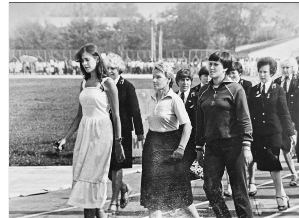
Инициативную молодую сотрудницу избрали секретарем комсомольской организации — здесь проявились ее организаторские способности, умение вести за собой людей

Она родилась в шахтерской семье в городе Коркино. Росла очень активным ребенком. С малых лет участвовала во всех классных и школьных мероприятиях, собирала металлолом и макулатуру, высаживала деревья и кустарники — была членом общества охраны природы, помогала пожилым людям как путеводитель. Уж очень ей хотелось посмотреть страну, увидеть мир. Потому после окончания школы решила поступить в железнодорожный техникум, подавала документы на специальность «Радиотехник в пассажирских поездах». Как оказалось, этой специальности уже не существовало, но железнодорожником наша героиня стала и посвятила этой профессии 39 лет. Начинала свою профессиональную карьеру начальником поезда — объездила всю страну, как в юности хотела. Инициативную молодую сотрудницу избрали секретарем