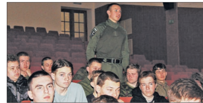
Ветераны Чебаркульского района приняли участие в заключительной встрече шестой смены сборов учащихся 10-х классов и студентов техникума Карталинского, Варненского районов и Верхнего Уфалея.

Мероприятие проходило на площадке Увельской средней школы № 2, в нем приняли участие советники директоров по патриотическому воспитанию, председатели первичных отделений «Движения первых» из 16 школ района, заместители директоров по воспитательной работе, психологи школ и, конечно, дети. Открыла форум