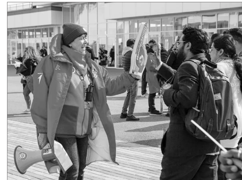
У волонтеров на фестивале была очень насыщенная работа